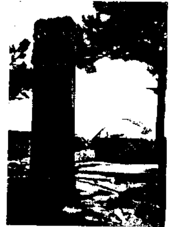
Bayaras Grabstele und Tumulus.