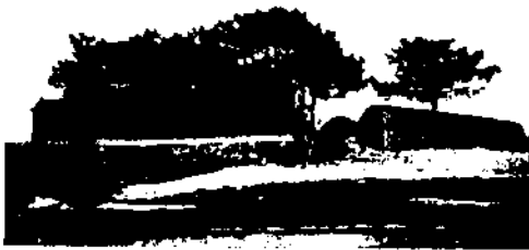
Bayaras und Yarhacis Grabanlage.