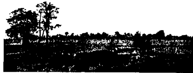
Dorf Tung-ching-ling. In der Mitte wird der Pavillion mit S'urhacis Stele etwas sichtbar. Links im Vordergrund das Grab von Ch'i-shih.