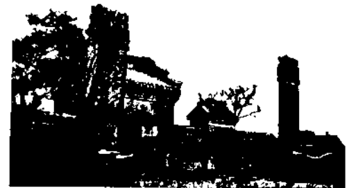
Links Murhacis, rechts Darcas Stele. Dahinter die Eingänge zum Grabplatz.