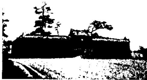
Cuyengs Grabanlage mit vermauertem Zugang.