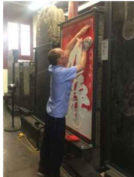
圖二：碑林博物館

此次研習營的分組，由於我們這組學員有文學、藝術、歷史等領域，所研究的朝代、議題也不同，關注的角度便能凸顯研習營分組討論的旨趣，所以在討論有時也會蹦出新的靈感或發現。但在討論過程中，也常感自己學識之不足，誠如多位老師在討論的提醒，開拓宏觀的視野還是多讀書吧。最後，很開心能參加此次的研習營，在這十二天的活動中感謝在授課的老師們和背後默默協助的工作人員們。